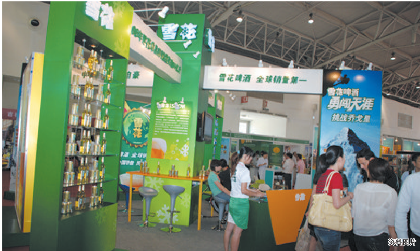
回收竞争对手的酒瓶、强行换走终端的啤酒,华润雪花啤酒日前因涉嫌不正当竞争被河北承德市工商局处以2万元罚款。随着各大啤

值得一提的是,尽管粮食连年增产,但与众多工业品的产能过剩相比,我国农产品供应却处于紧平衡状态,未来一段时间我国每年还将平均新增200亿斤粮食的刚性需求。这样的背景下,适度合理的农产品价格上涨,可能不仅仅出现在今年。而在经济学家看来,通胀预期并不是受短期价格涨跌影响,而是受居民对较长时期的物价走势判断的影响。(理 晓)