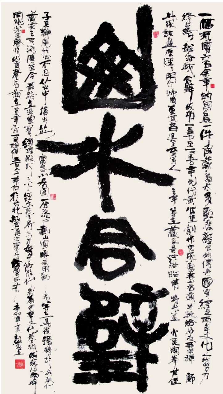
山水合璧 2010年 180cm×97cm

彭敏全作品走进文化名城系列——作品曾在台儿庄、青岛、北京以及深圳、中山、东莞、杭州、上海、青州、江门等地展出。作品被美国、欧洲、日本、埃塞俄比亚、澳大利亚、新加坡、东南亚以及中国香港、台湾、澳门等多个国家和地区的企业界人士收藏。