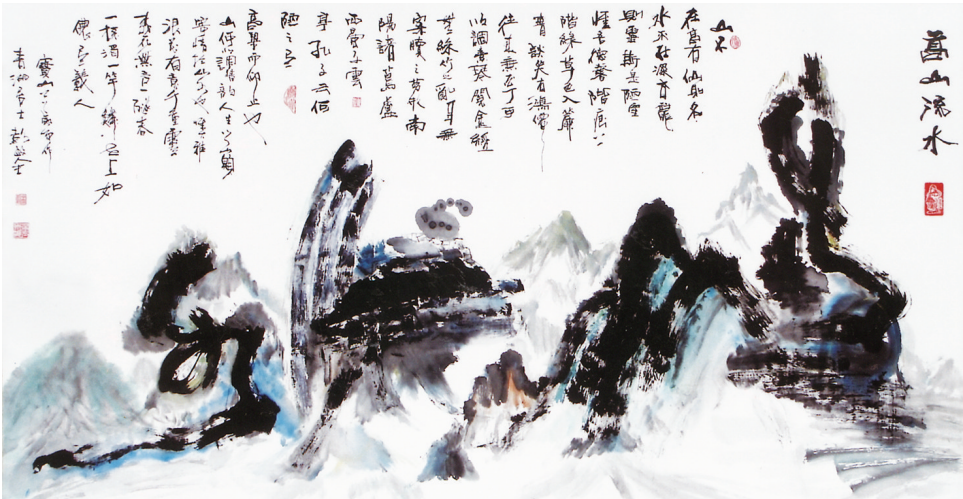
高山流水 2005年 180cm×97cm

大胆的创想,但又在结字造型上强调均衡和工稳,对于“高山流水”作品的创作,严格上来说,虽是一幅书法作品。但又不仅仅是一幅书法作品,而更多是一幅书、画揉合在一起创作的“现代写意山水”作品。在欣赏视觉上给人一种极强的视觉冲击力和想象空间,从而让人对