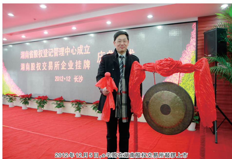
2012年12月5日，e宅购在湖南股权交易所敲锣上市

“水惟善下能成海，山不争高自极天。”e宅购以创业起家，不正虚名，以创造实实在在的为社会价值为行为准则，始终坚守“为天下创业者创富”的信念，以“助力中小微企业成长，服务创业人士”为宗旨，广接地气，树立为社会解决就业、创造价值的企业文化，这是e宅购作为电商后起之秀，在电商战场