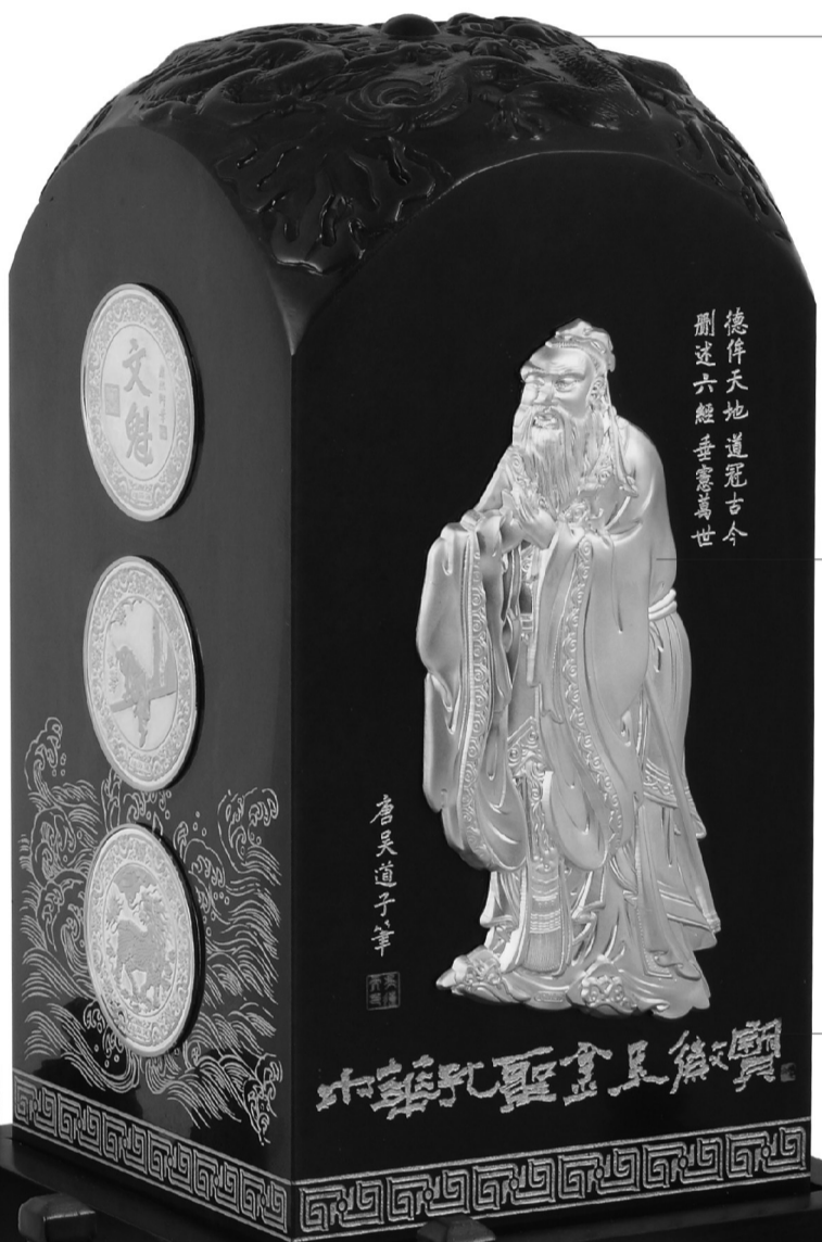
天圆地方 飞龙在天