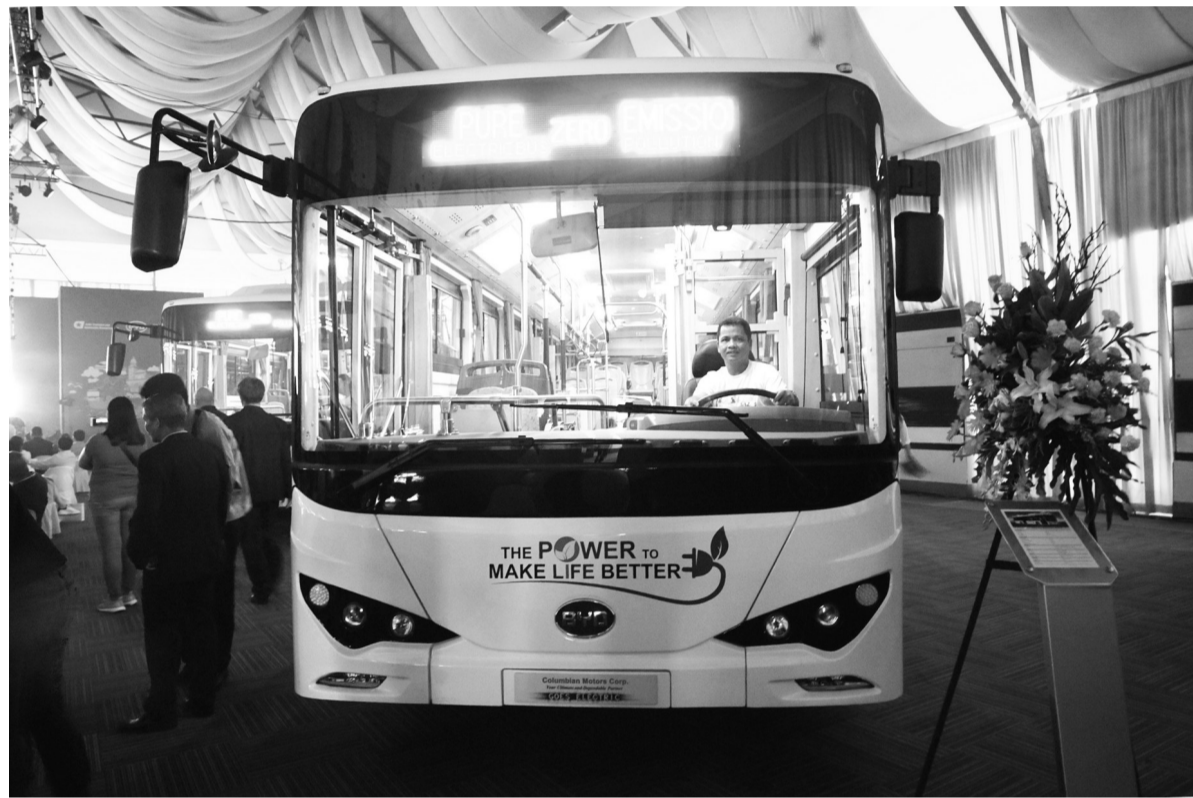
近日,比亚迪股份有限公司向菲律宾CMC公司交付首批两辆纯电动巴士K9。图为交接现场。截至目前比亚迪已累计向全球合作伙伴出口超过3.5万辆纯电动巴士。