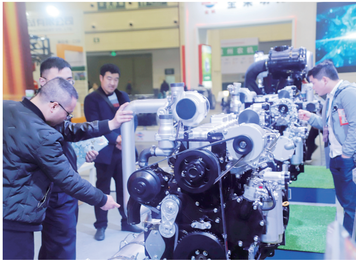
日前，由中国农业机械工业协会、中国农业机械化协会、中国农业机械流通协会共同主办的2019全国农业机械及零部件展览会(简称全国农机展)在郑州国际会展中心举办。经过多年的培育和发展，全国农机展已成为全国春季规模最大、最具影响力的农机宣传、展示、交易平台。(王中举)

2019最美会展玫瑰授予仪式在重庆国际博览中心举行，共有15位在大中华区从业10至30年以上的女会展人荣获2019最美会展玫瑰称号。