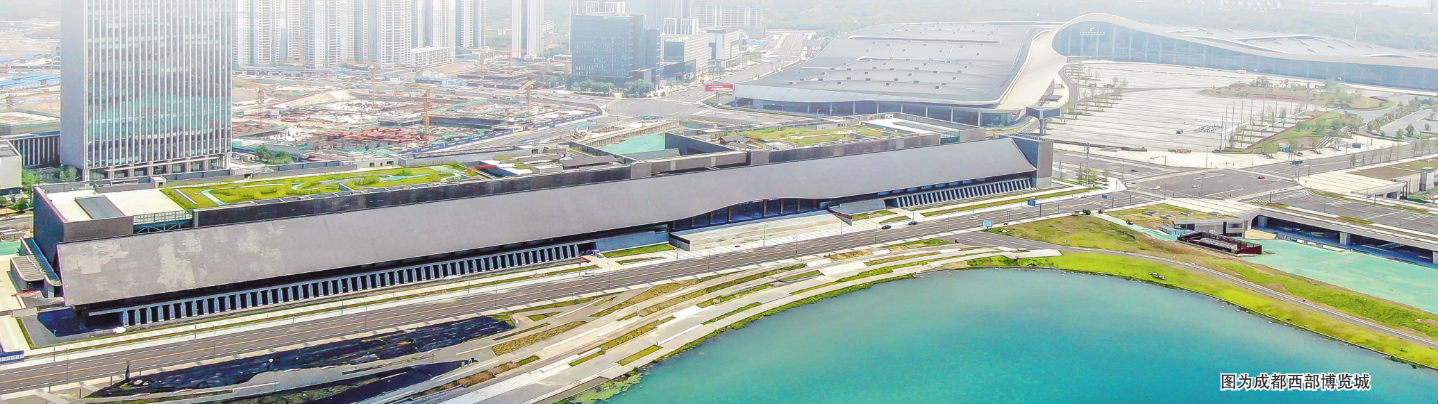
图为成都西部博览城

《成都市“十四五”国际会展之都建设规划》出炉,明确提出了“十四五”会展业发展的指导思想、基本原则和发展目标。到2025年,立足会展业高质量发展,形成优质高效、结构优化、竞争力强的现代会展产业体系,将成都建设成为具有全球影响力的国际会展之都。