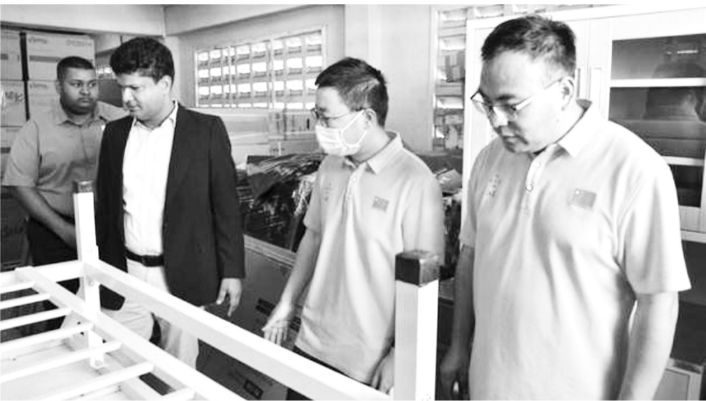
由第十九期中国援圭亚那医疗队和乔治敦公立医院合作推进、中海油圭亚那有限公司出资捐赠的中医推拿设备日前全部移交至乔治敦公立医院中医中心，助力中医中心完成设备全面升级。圭亚那中医中心于今年8月成立，承担在当地传播中医药文化的职责。图为乔治敦公立医院执行院长接收捐赠物资。